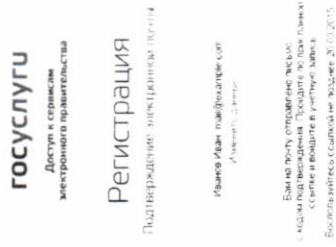
Рисунок 4. Страница подтверждения адреса электронной почты

Если выбран способ регистрации по электронной почте, то отобразится страница подтверждения адреса электронной почты пользователя (рис. 4).