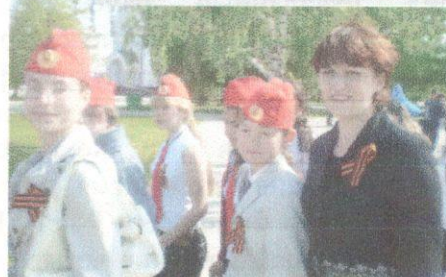
Пусть всегда будет солнце!