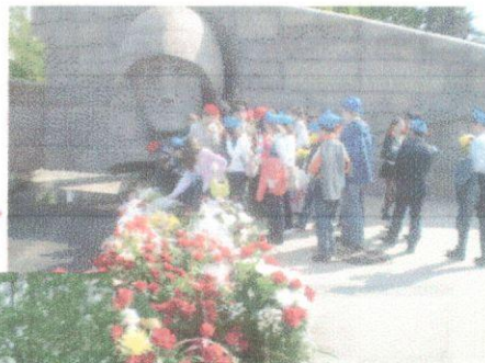
У вечного огня