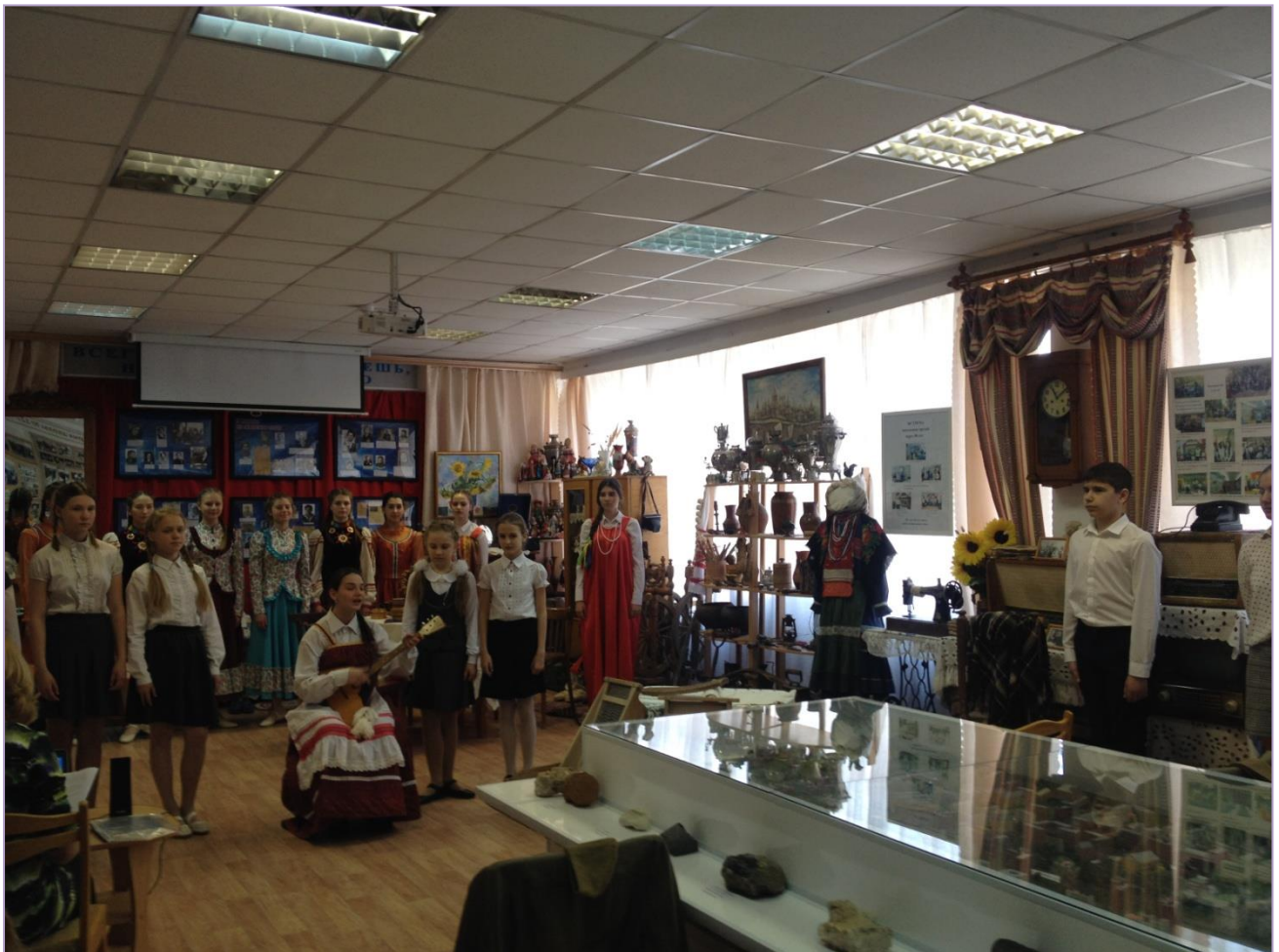
Фрагмент экскурсии на тему: «Милая сердцу малая Родина»