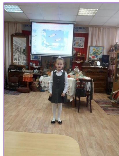
Праздник Белых журавлей. Конкурс чтецов. Начальная школа.