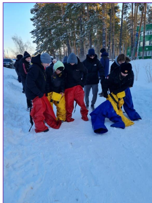
Фотографии 9а класса на новогодних каникулах.